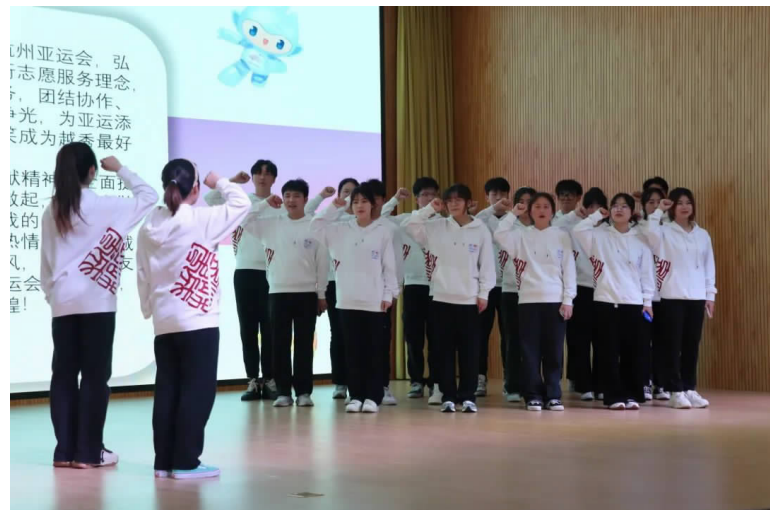
志愿者代表们上台宣誓